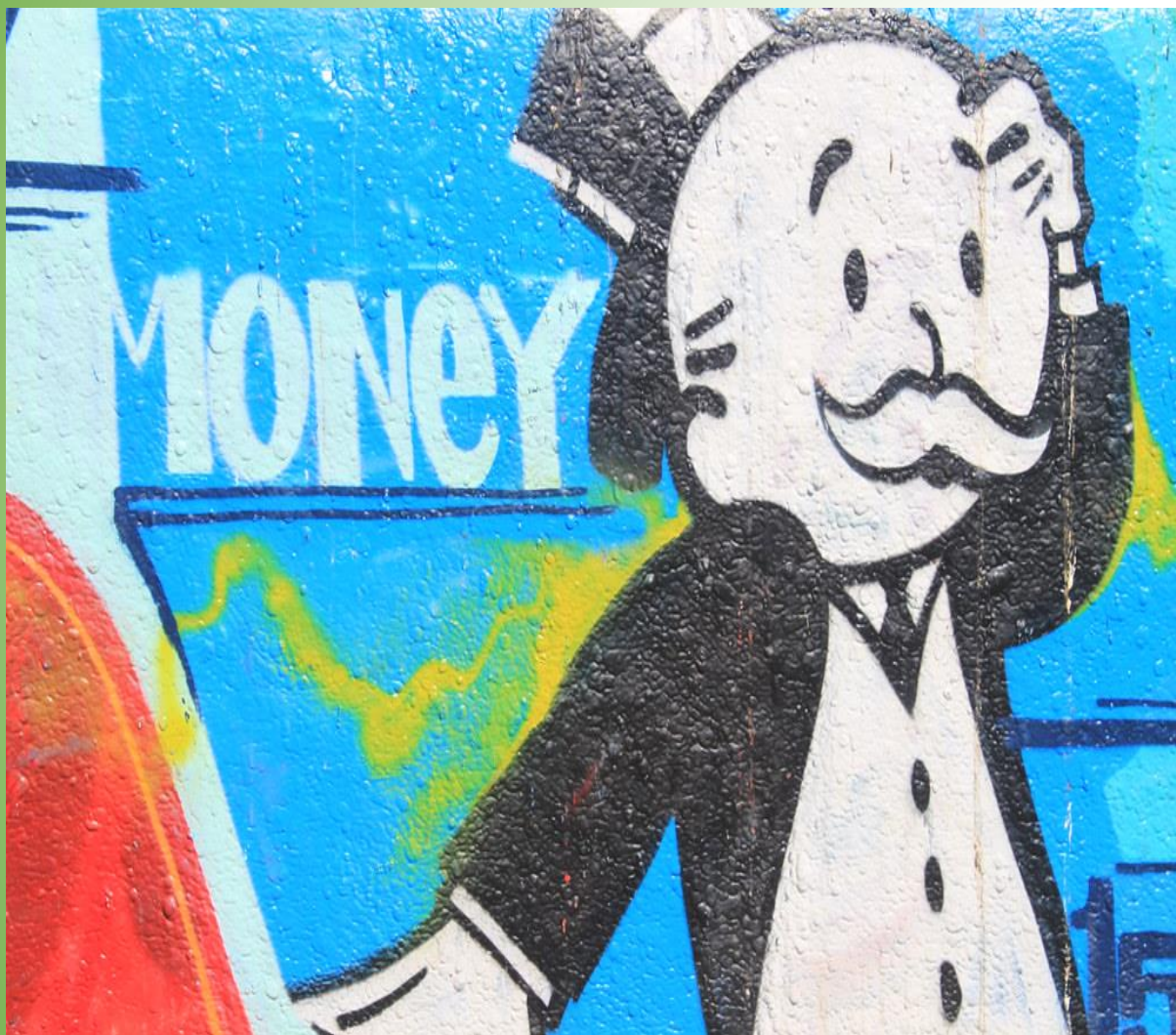
"Money!" by ToGa Wanderings is licensed with CC BY 2.0.