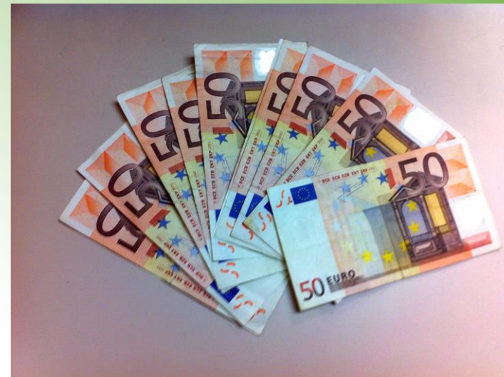
"50 euros" by Remo- is licensed under CC BY-NC 2.0